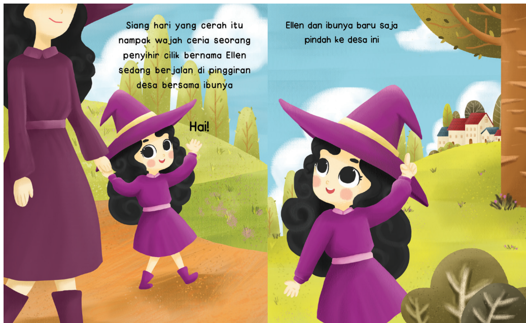
Gambar 6. Gambar interaktif lift the flap