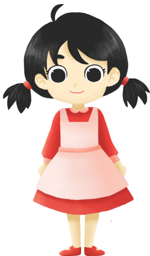
Gambar 3. Desain Karakter Anak Desa

kesan unik, memiliki ciri khas, berbeda dan tidak flat . Bajunya dibuat mengembang agar tidak flat dengan rok jatuh kebawah, karena anak-anak lebih tertarik pada baju mengembang seperti princess. Anak Desa juga dibuat seimut mungkin, walau diawal ia memiliki kesan yang kurang baik tapi Anak Desa tetap memiliki hati yang baik. karena buku ini ditujukan untuk anak-anak, dengan harapan karakter yang awalnya disangka jahat tetapi tetap baik hati