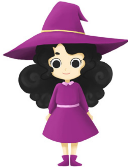
Gambar 2. Desain Karakter Ellen

Ellen adalah seorang penyihir berumur 8 tahun, lahir pada 7 September. Memiliki sifat baik hati, perhatian, suka menolong dan suka berjuang. Ellen adalah seorang anak tunggal yang dibesarkan oleh ibunya. Ellen dan ibunya berasal dari desa yang mayoritas penduduknya adalah penyihir tetapi mereka memutuskan untuk berpindah ke desa yang mayoritas penduduknya adalah manusia.