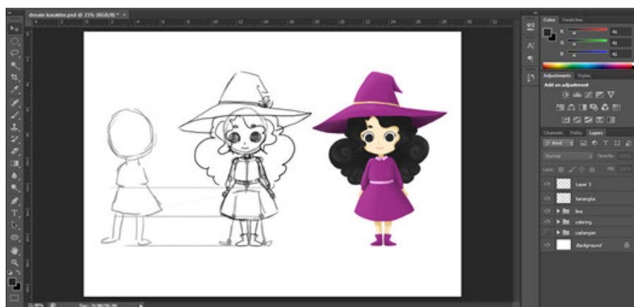
Gambar 4. Proses Desain Karakter

Kemudian masuk ke tahap Coloring , di tahap ini sangat mengandalkan line art . Di tahap awal pewarnaan adalah pemberian warna dasar, jika warna sudah mengikuti patokan line art, layar pada line art bisa dinonaktifkan dan mulai memainkan gradasi warna menggunakan layer yang berbeda-beda.