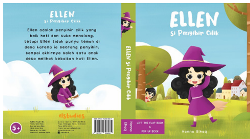
Gambar 5. Proses Perancangan Cover Buku