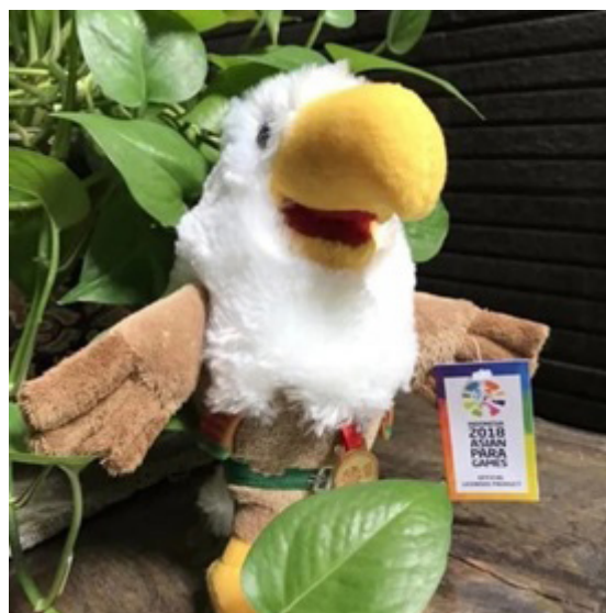
Gambar 5: Merchandise Maskot Momo berbentuk boneka 1