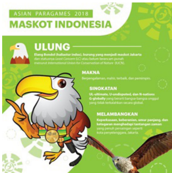
Gambar 1: Maskot awal APG 2018 ( http://wartakota.tribunnews.com/2018/09/05/ini-arti-nama-momo-maskot-asian-para-games-2018 )

tantangan zaman yang penuh persaingan seperti kota penyelenggara, yaitu Jakarta.