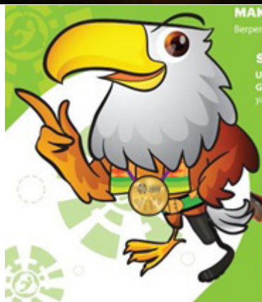
Gambar 7: Kaki jogger-prosthetic pada maskot Momo