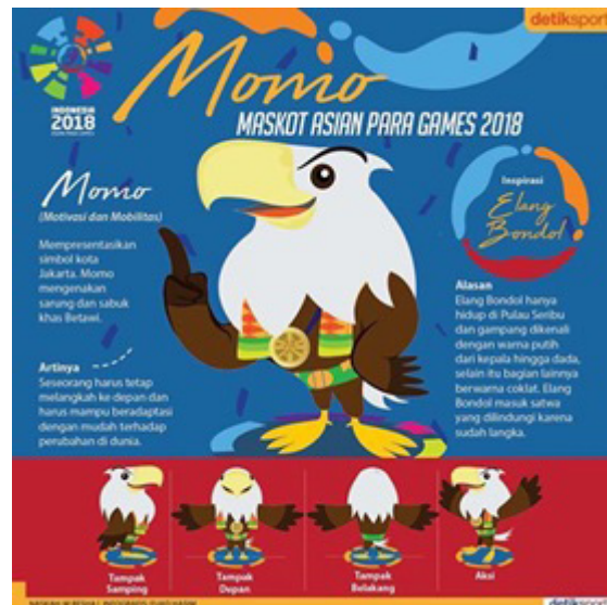
Gambar 2: Maskot awal APG 2018

Namun kemudian terjadi perubahan nama dan penjelasan konsep yang diselesaikan dengan pendekatan tema sedikit berbeda. Pada gambar 2, Maskot APG 2018 terpilih dengan nama “Momo” yang merupakan singkatan dari mobilitas dan motivasi. Momo merepresentasikan simbol kota Jakarta. Momo mengenakan sarung dan sabuk khas tradisional Betawi, yang artinya seseorang harus tetap melangkah ke depan dan harus mampu beradaptasi dengan mudah terhadap perubahan dunia. Lalu Inspirasi Elang Bondol dibuat karena Elang Bondol hanya hidup di Pulau Seribu dan gampang dikenali dengan warna putih dari kepala hingga leher. Selain itu bagian badannya berwarna coklat. Pada gambar di atas diterangkan bahwa profil dari burung Elang Bondol merupakan satwa