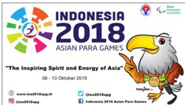
Gambar 3: Maskot Momo dalam media spanduk horizontal