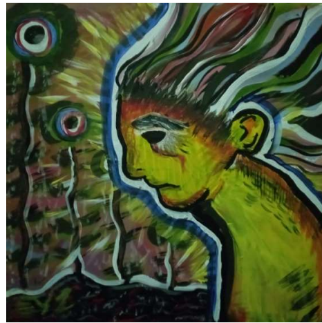
Gambar 2. Seni Digital "Man In Blow"