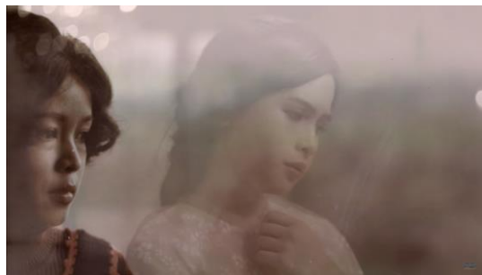
Gambar 3 Transisi keselarasan : Kamu & Kenangan ( Official Music Video )