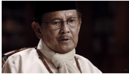
Gambar 1 B.J. Habibie : Kamu & Kenangan ( Official Music Video )