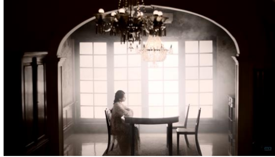
Gambar 6 Potrait perasaan kehilangan dan kesepian : Kamu & Kenangan ( Official Music Video )