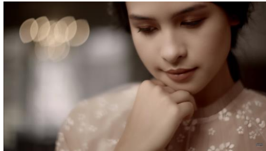
Gambar 4 Senyuman tipis : Kamu & Kenangan (Official Music Video)