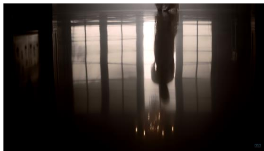
Gambar 5 Bayangan kehilangan : Kamu & Kenangan (Official Music Video)