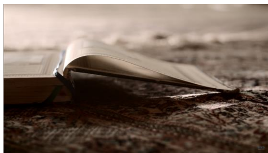
Gambar 9 Simbol Keyakinan dan Ketakwaan : Kamu & Kenangan (Official Music Video)