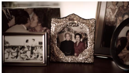
Gambar 2 Foto B.J. Habibie & Ainun : Kamu & Kenangan ( Official Music Video )